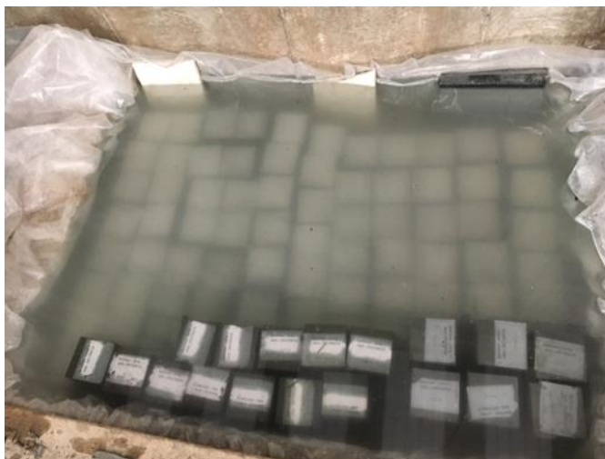
شکل ۸- عمل آوری بتن ساخته شده [۱۳].