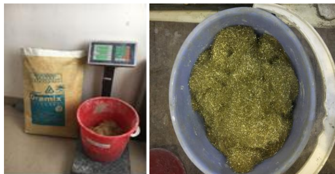
شکل ۳- میکرو الیاف فولادی مصرفی در ساخت UHPFRC.