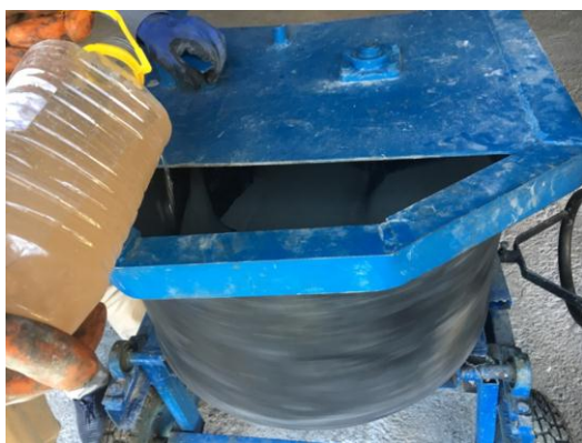
شکل ۵- مخلول روان‌کننده و آب برای ساخت بتن [۱۳].

گیری مصالح یاد شده در ظرف‌های تعیین شده مطابق شکل ۴، مصالح با بهره‌گیری از توصیه‌های فوق‌الذکر در داخل دیگ میکسر قرار می‌گیرد. فوق روان‌کننده در ظرفی با آب مخلول شده و در هنگام هم‌زدن میکسر مطابق شکل ۵ به مصالح خشک اضافه می‌شود. با توجه به سعی خطاهای انجام گرفته در ساخت، بهترین حالت زمانی اتفاق می‌افتد که حدود ۷۰ درصد آب و فوق روان‌کننده به مصالح اضافه می‌گردد سپس مخلوط به حالت دانه‌های نخودی نیمه اشباع در می‌آید که در این وضعیت در حدود ۵ دقیقه بدون اضافه کردن آب و فوق روان‌کننده، عمل اختلاط به وسیله میکسر صورت می‌گیرد، مابقی آب و فوق روان‌کننده به مخلوط اضافه شده تا بتن به حالت خمیری و چسبنده تبدیل گردد، میکرو الیاف در حین اختلاط با میکسر با الک کردن و یا پخش آرام دستی به بتن اضافه می‌گردد همان‌گونه که در شکل ۶ نشان داده شده است که برای ریختن میکرو الیاف حدود ۵ دقیقه زمان صرف می‌شود سپس بتن در داخل قالب‌ها ریخته شده و عمل ویریه زدن به منظور قرارگیری بتن به صورت لرزش قالب با توجه به خصوصیت خودتراکمی این نوع از بتن انجام می‌پذیرد. شکل ۷ نحوه قرارگیری بتن در داخل نمونه‌های مکعبی ۱۰ سانتی‌متری را نمایش می‌دهد [۱۳]. نمونه‌های ساخته شده پس از عمل‌آوری مطابق شکل ۸ در دستگاه پرس استاندارد طبق شکل ۹ مورد بارگذاری فشاری قرار می‌گیرند و مقاومت فشاری در سنین مختلف بدست می‌آید.