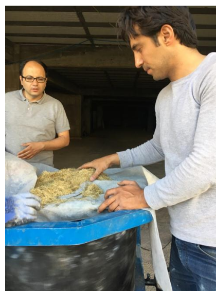
شکل ۶- میکرو الیاف برای ساخت بتن [۱۳].