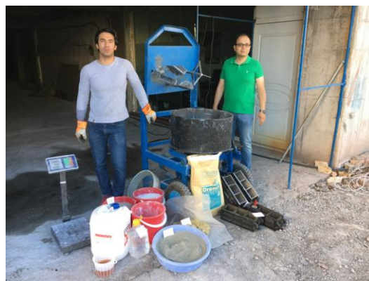
شکل ۴- میکسر مورد استفاده و مصالح مصرفی برای ساخت بتن [۱۳].