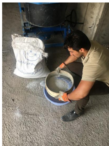
شکل ۱ - الک کردن میکروسلیس جهت از بین بردن کلوخه‌های آن

میکروسلیس به کار رفته در این تحقیق از شرکت فروآلیاژ ایران تهیه شده و دارای بیشینه بعد ۲۲۹ نانومتر میلی‌متر می‌باشد این ماده که با نام‌های سیلیکا فوم ۲ و دوده سیلیس نیز شناخته می‌شود، محصول فرعی کوره‌های قوس الکتریکی صنایع فروآلیاژ و فروسیلیس بوده و ماده‌ای است با فعالیت پوزولانی بسیار شدید که بیش از ۸۵ درصد سیلیس بلوری نشده دارد [۷]. شکل ۱ الک کردن میکروسلیس به منظور حذف کلوخه‌های جزئی موجود در آن، قبل از استفاده در ساخت بتن را نشان می‌دهد. لازم بذکر است که میکروسلیس در حین دپو و نگهداری با جذب فوری رطوبت محیط بصورت کلوخه‌ای در می‌آید و حذف کلوخه‌های آن باعث ترکیب مناسب آن با دیگر مصالح ریزدانه می‌گردد که این مشکل با عبور آن از الک حل می‌گردد.