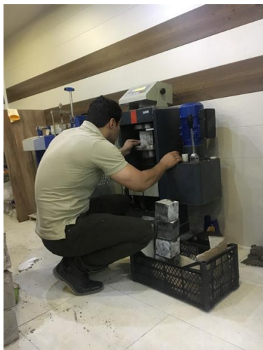
شکل ۹- بارگذاری نمونه‌های ساخته شده [۱۳].