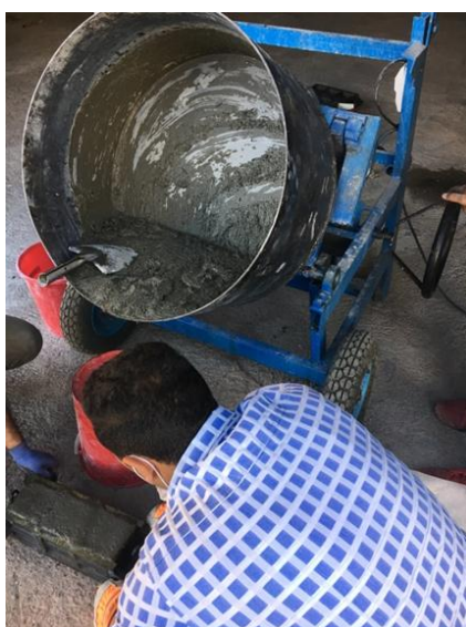
شکل ۷- قرارگیری بتن درون قالبهای استاندارد [۱۳].