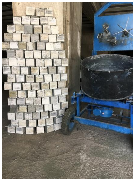
شکل ۱۰ نمونه‌های مکعبی UHPC تست شده مربوط به جدول ۲.

برخی از نمونه‌های شکسته شده پس از آزمایش مقاومت فشاری در شکل ۱۰ نشان داده شده است.