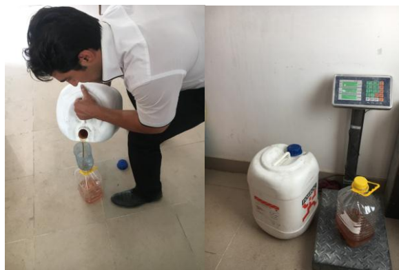
شکل ۲ - فوق روان کننده مصرفی برای ساخت بتن توانمند

به دلیل نسبت آب به سیمان کم در بتن با کارایی بسیار بالا، استفاده از فوق روان کننده نقش تعیین کننده ای در رسیدن به کارایی مورد نظر دارد بطوریکه توسعه بتن UHPFRC بدون استفاده از فوق روان کننده امکان پذیر نمی باشد. در این پژوهش از فوق روان کننده AURAMIX 4450 استفاده شده است که از شرکت فسروک تهیه شده، که در شکل ۲ نشان داده شده است.